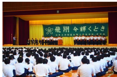
昨年の全国大会壮行会の様子

近畿大学附属和歌山高等学校(和歌山県和歌山市)は、平成 29 年(2017 年)7 月 10 日(月)に、全国大会に出場する運動部 5 団体の生徒 24 人に対して、全校生徒がエールを送る「全国大会壮行会」を実施します。