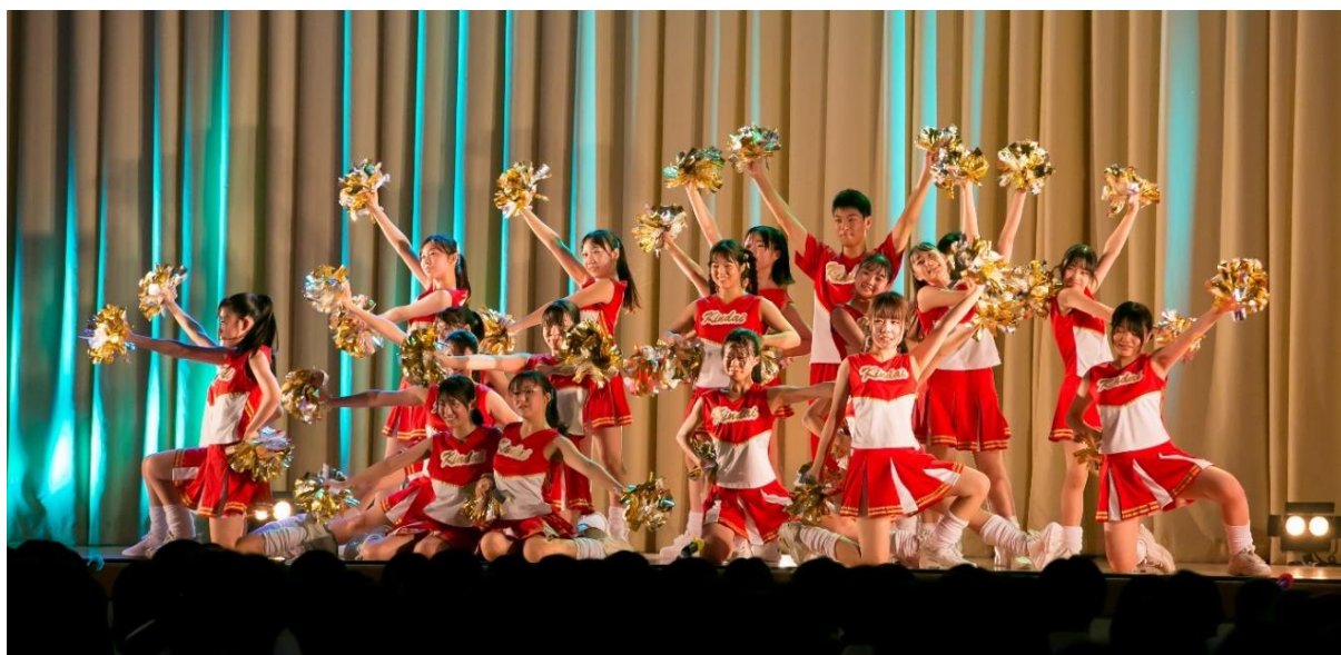
令和5年度（2023年度）文化祭の様子

近畿大学附属和歌山高等学校・中学校（和歌山県和歌山市）は、令和6年（2024年）9月5日（木）・6日（金）に文化祭、10日（火）に体育祭を開催します。今年の光雲祭のテーマは「Be Real ~"今"を生きれないの厳しいって~」で、全校生徒1,571人が参加します。